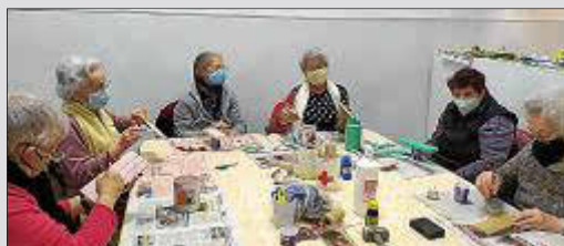
L'entitat organitza tallers de tot tipus.

L'activitat de l'entitat a la Vall s'ha multiplicat gairebé per cinc degut a la crisi. Actualment l'organització atén a 230 persones, res a veure amb la cinquantena d'abans de la Covid PÀG. 2-3