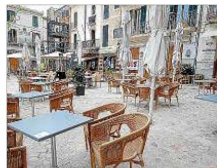
L'associació de bars i restaurants confirma que no els hi surt a compte.