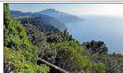
El Consell vol protegir també els elements culturals.

El Consell de Mallorca celebra enguany el desè aniversari de la declaració de la Serra de Tramuntana per la Unesco PÀG. 2-3