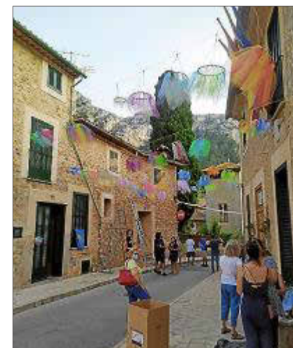
El passat dimecres els voluntaris engalanaren els carrers de la localitat.