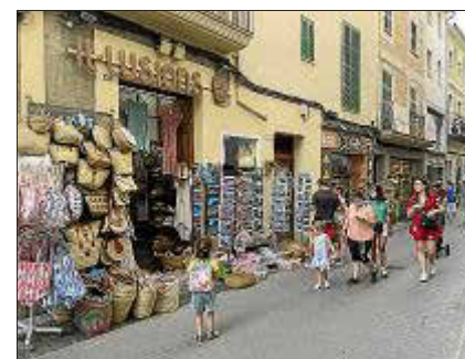
La quantitat que es donarà a empreses i autònoms serà de 1.500 euros.

L'Ajuntament fixa com a possibles receptors negocis amb menys de 10 treballadors i una davallada de la facturació del 40% PÀG. 4